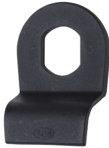
Dimensiones de orificio del bombillo